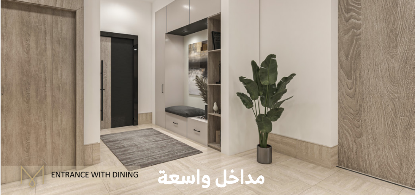
ENTRANCE WITH DINING