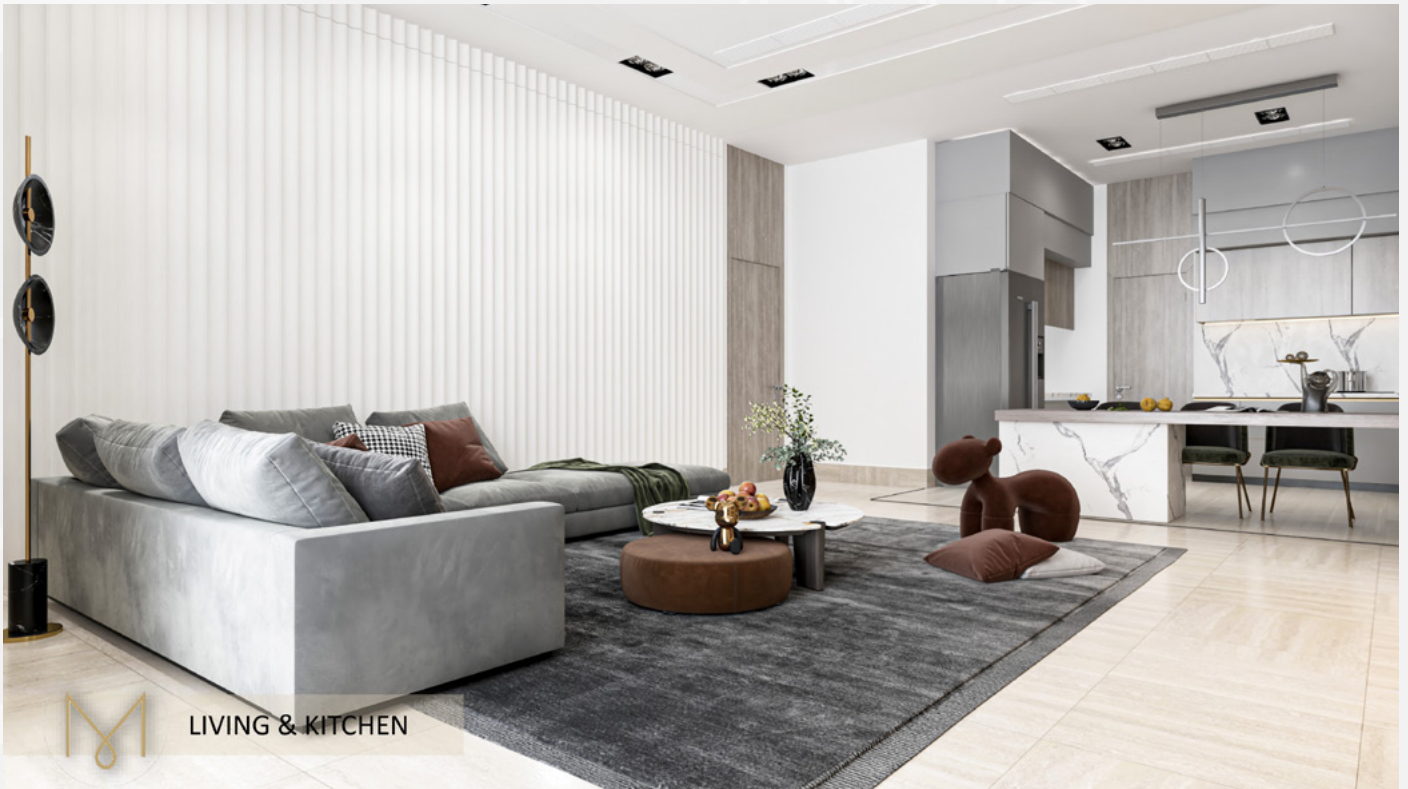
LIVING & KITCHEN